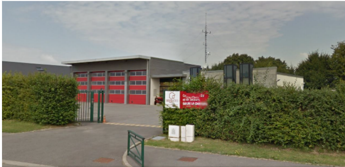
VUES DEPUIS L'ESPACE PUBLIC

Enfin, l'espace extérieur accueille des zones de manoeuvres et de lavage pour les véhicules d'intervention, un parking pour le personnel et des espaces verts.