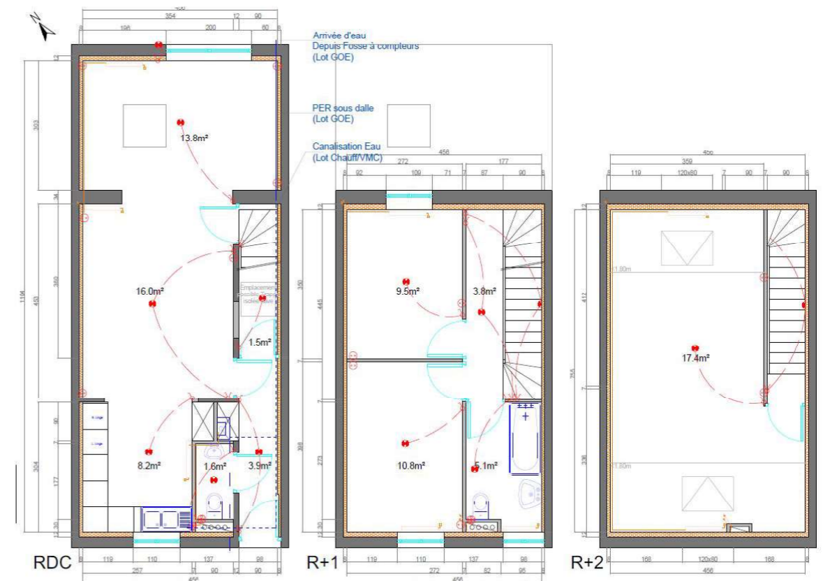
ETAT PROJETE - Plans de niv

Le projet concerne la réhabilitation des anciens logements des douanes situés à Neuville en Ferrain en leur redonnant une visibilité architecturale dans le paysage urbain en réaffirmant sa composition de façade. Il s'agit de 6 maisons individuelles en R+1+comble, composées de manière identique, en briques peintes de couleur ton pierre, d'une toiture 2 pans en tuiles de ton rouge orangé et les menuiseries sont en pvc de teinte blanche. Des petites extensions sont accolées en façade arrière.