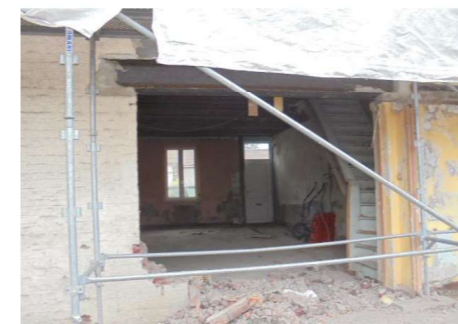
ETAT PROJETE - Photos de chantier en cours Ouverture en façades arrière pour futures extensions