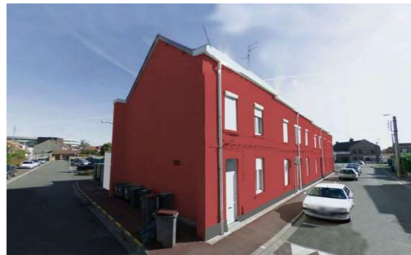
ETAT PROJETE - image de synthèse