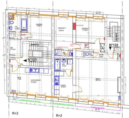
PLAN DE REAMENAGEMENT R+1

Le remplacement des menuiseries et l'isolation des parois extérieures du logement permettront également aux utilisateurs de bénéficier de plus de confort thermique.