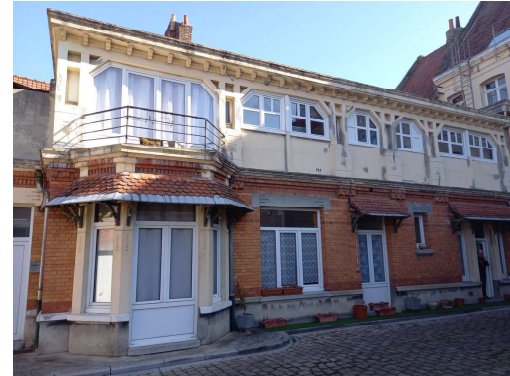
PHOTOGRAPHIE AVANT TRAVAUX