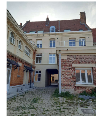
ETAT REEL APRES TRAVAUX

Le bâtiment n'est pas conforme à la RT RENOVATION au sens des ThCex.