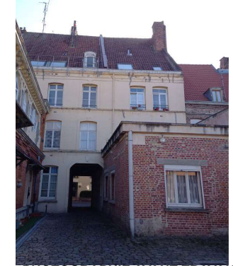
PHOTOGRAPHIE AVANT TRAVAUX