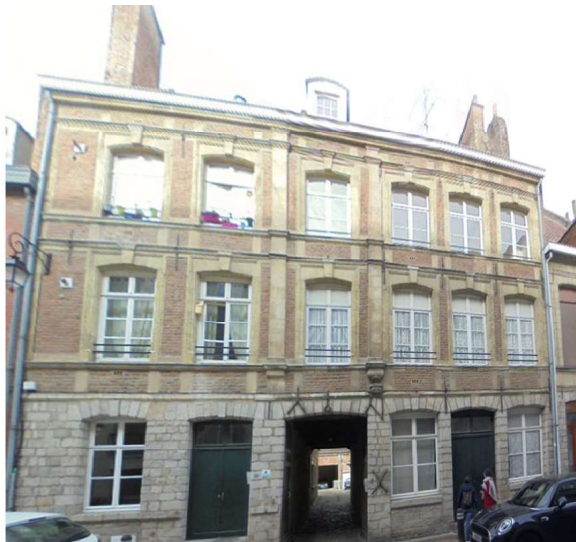
PHOTOGRAPHIE DE LA FACADE PRINCIPALE DONNANT SUR RUE