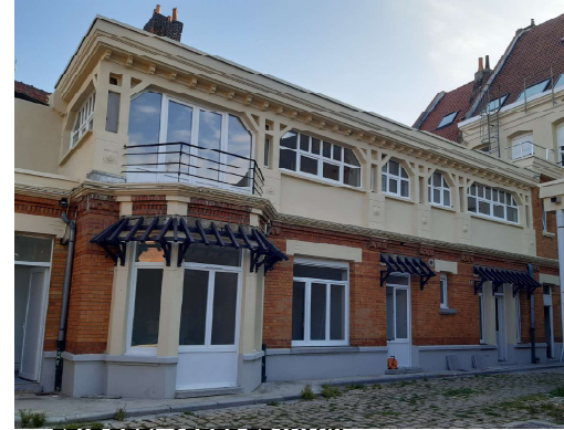
ETAT REEL APRES TRAVAUX