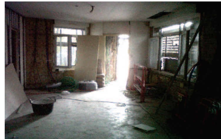
SEJOUR PENDANT TRAVAUX