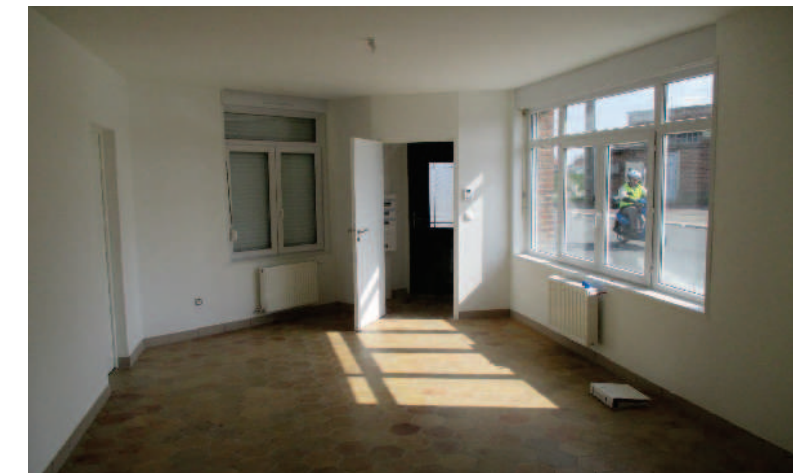
SEJOUR APRES TRAVAUX