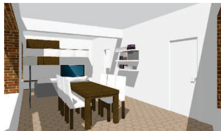
VUE DU SEJOUR PROJETE