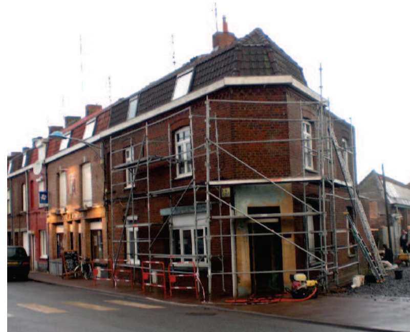
FACADE AVANT PENDANT TRAVAUX

Le remplacement des menuiseries et l'isolation des parois extérieures du logement permettront aux utilisateurs de bénéficier de plus de confort thermique.