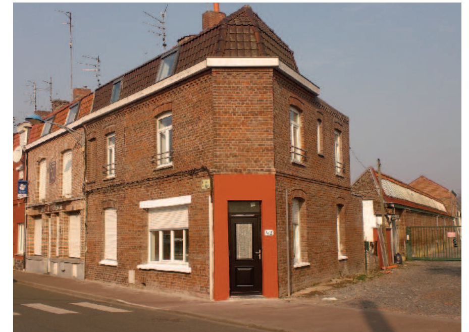
FACADE AVANT APRES TRAVAUX